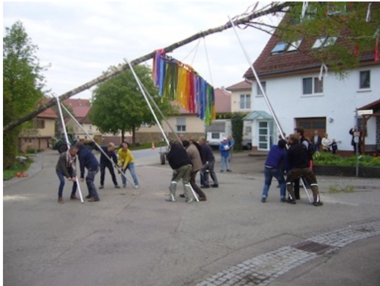
Bilder und Bericht Jürgen Springer

Der Maibaum-Hock fand am Info-Pavillon statt. Auch der traditionelle Kindermaibaum wurde wieder mit Unterstützung der Kinder und Eltern auf dem Spielplatz am Pavillon aufgestellt. Der Baum wurde von den Kindern und Eltern geschmückt. Der Platz am Info-Pavillon, der für den Maibaum-Hock genutzt wurde, war gut gefüllt. Für das leibliche Wohl hatte die Dorfgemeinschaft wie immer bestens gesorgt.